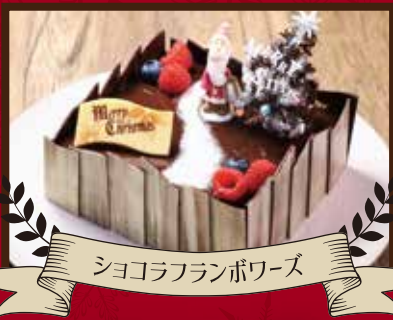
ショコラフランボワーズ

苺をふんだんに使用した定番のショートケーキです。 ※写真はφ 15cm サイズにより飾りが異なります。 φ 15cm ¥3,200 / φ 18cm ¥3,800 φ 21cm ¥4,500