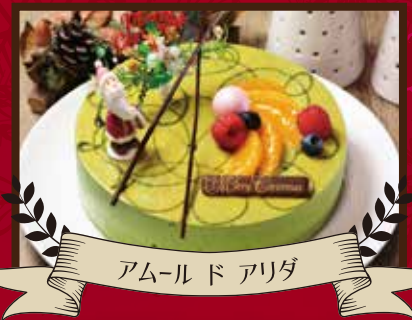
アムールドアリダ

しっとりとしたチョコレートの生地に コクのあるミルクチョコクリームとフランボワーズの ほのかな酸味がアクセントになった大人なケーキです。 φ 18cm ¥3,500